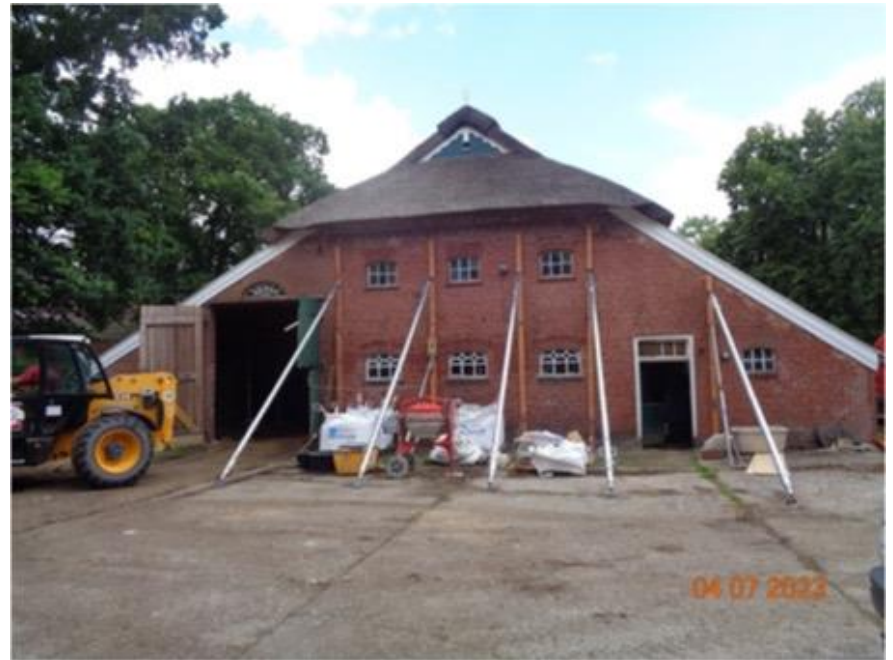
Beginn 2. BA mit Förderung LK (Stand 2023)