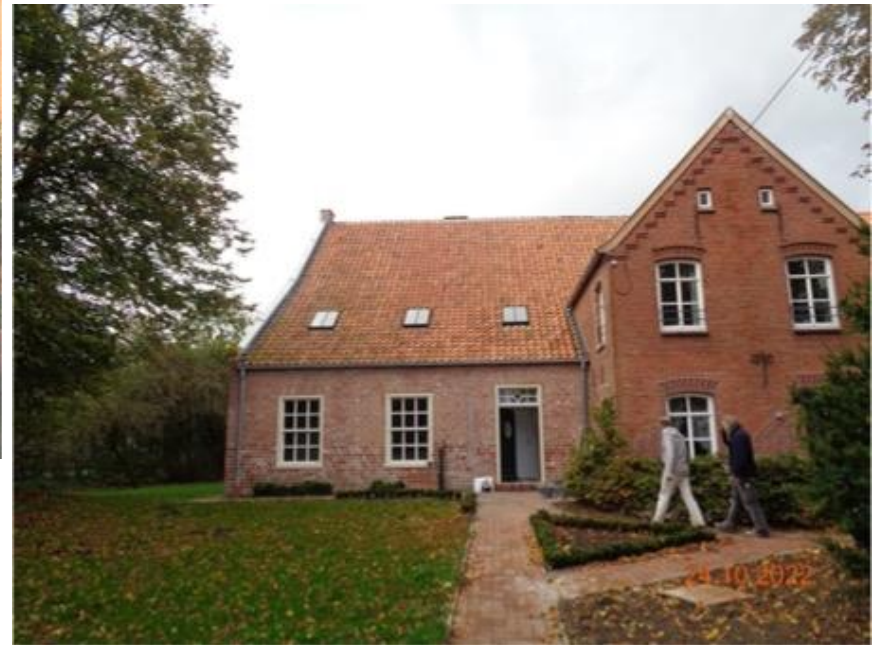
nach der Sanierung(Stand 2022)