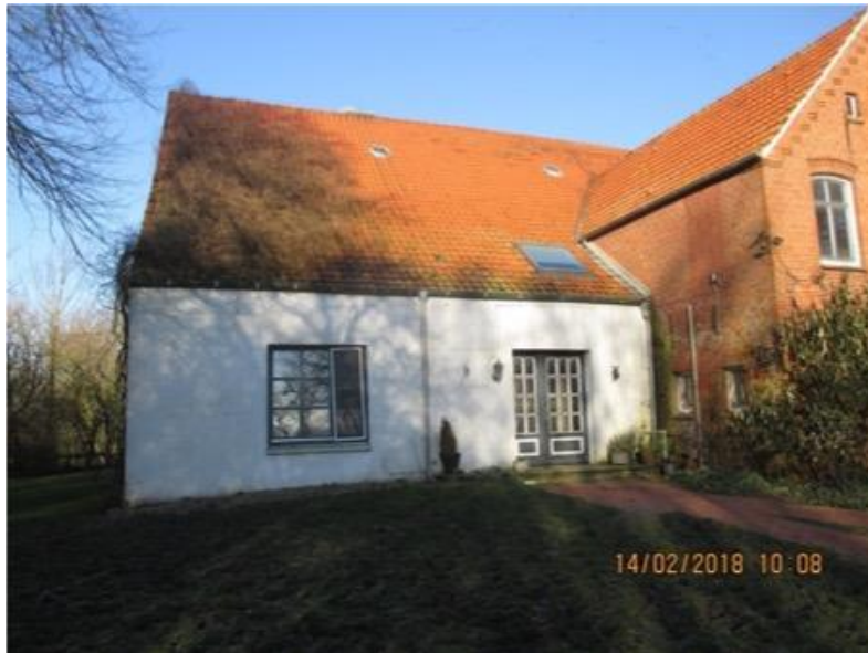
vor der Sanierung (Stand 2018)

(bewilligte Fördersumme: 60.000,- EUR / Kosten Gesamtmaßnahme 146.413,- EUR)