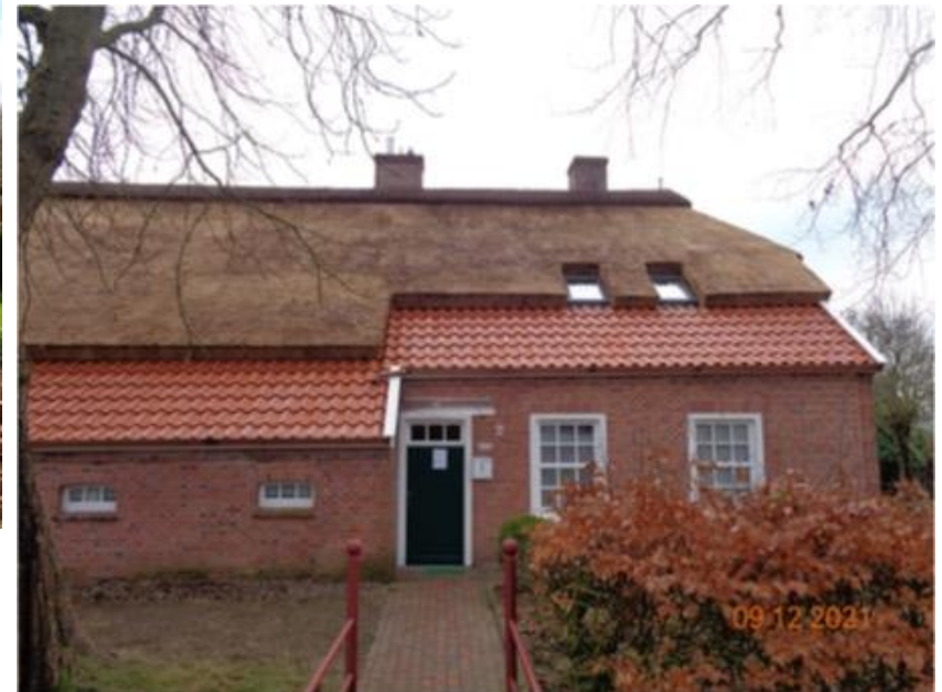
nach der Sanierung (Stand 2021)