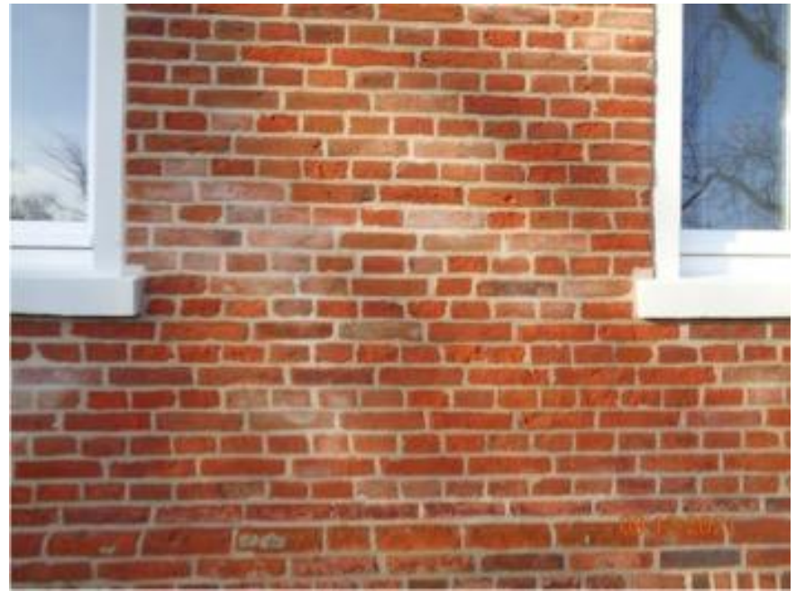
nach der Sanierung (Stand 2021)