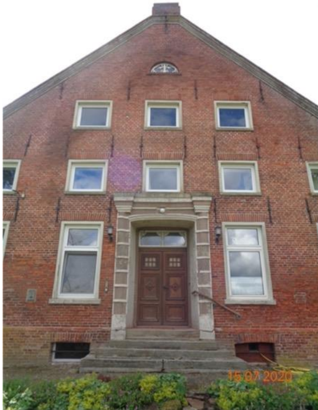
vor der Sanierung (Stand 2020)

(ausgezahlte Fördersumme: 20.000,-EUR / Kosten Gesamtmaßnahme 58.142,- EUR)