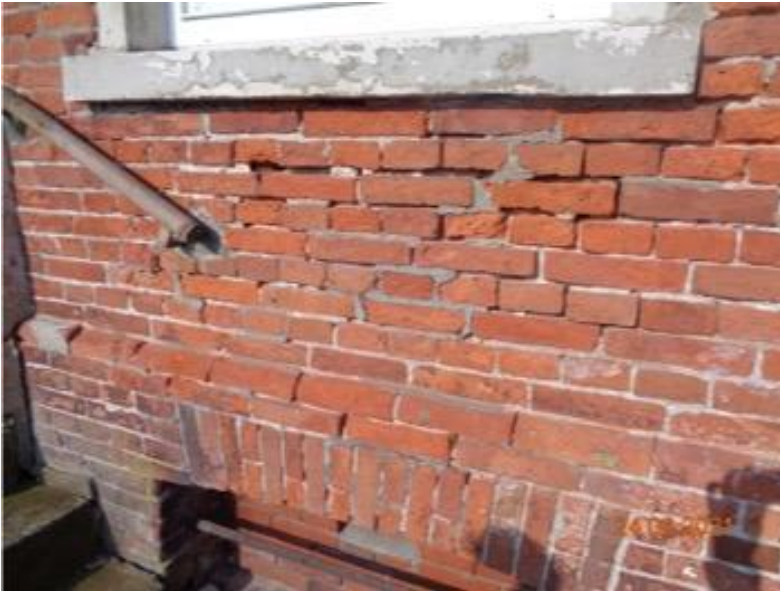
vor der Sanierung (Stand 2020)