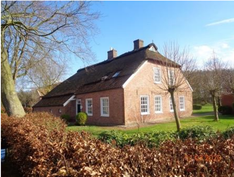
vor der Sanierung (Stand 2020)

(ausgezahlte Fördersumme: 29.600,-EUR / Kosten Gesamtmaßnahme: 78.549,- EUR)