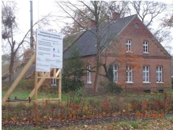
Beginn 1. BA ohne Förderung LK (Stand 2019)

(bewilligte Fördersumme: 60.000,- EUR 2. BA / Kosten Gesamtmaßnahme 2.8 Mio EUR)