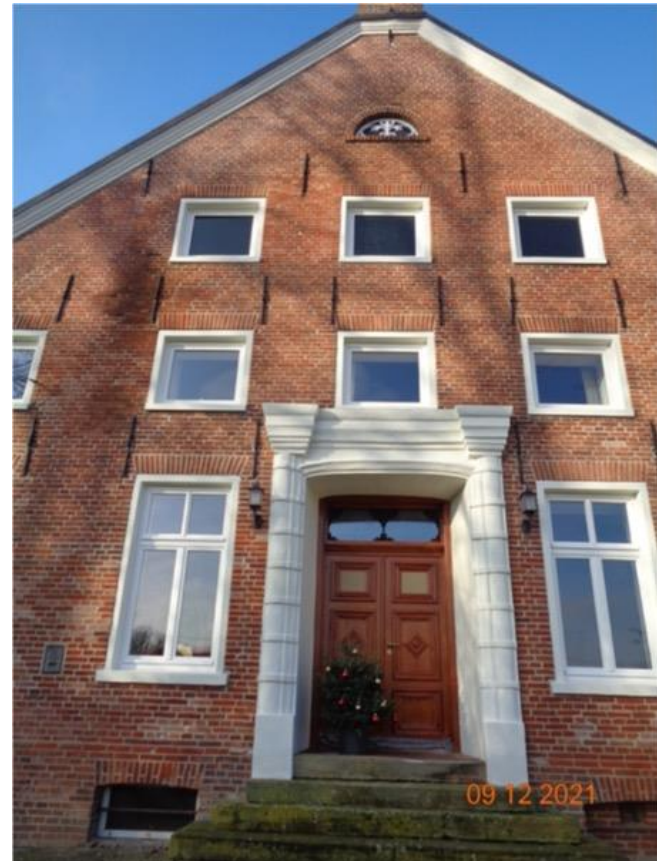
nach der Sanierung (Stand 2021)