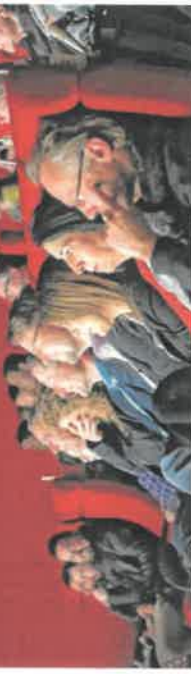
Der Film „Willkommen in Ostfriesland“ feierte am Freitag im Auricher Kino Premiere. Die Doku von und mit Flüchtlingen entstand aus einer Zusammenarbeit der Ostfriesischen Landschaft und der Kulturagentur Ostfriesische Landschaft. Seite 6

Filmprojekt „Willkommen in Ostfriesland“ erstmals im Auricher Kino gezeigt