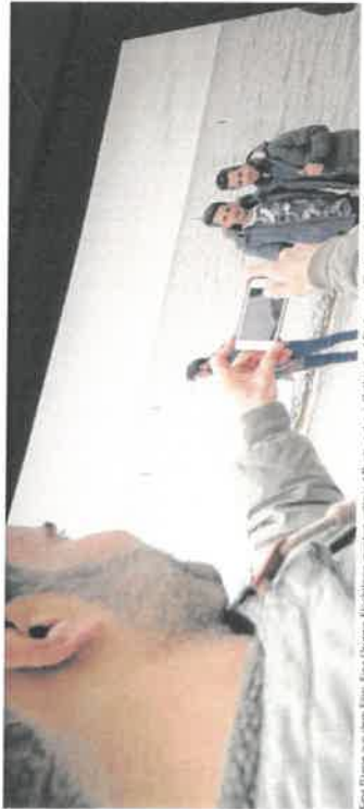
Ein Film von Herrn Bunt: Eine Gruppe Flüchtlinge macht einen gesteuerten Rückzug durch Ostfriesland. Bilden von Herrmann Hildebrandt.

Filmprojekt über Flüchtlinge in Ostfriesland feierte am Freitag Premiere im Auricher Kino