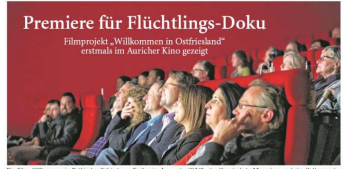
Die Film „Willkommen in Ostfriesland“ feiert am Freitag im Auricher Kino Premiere. Die Gäste von „Auf der sicheren Seite des Meeres“ sind am Freitag im Auricher Kino. Der Film ist ein Dokumentarfilm über die Integration von Flüchtlingen in die ostfriesländische Gesellschaft. Die Premiere findet am Freitag im Auricher Kino statt.