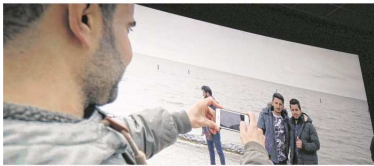
Ein Szenen aus dem Film: Ein Gruppe Flüchtlinge reist über Badstube durch Ostfriesland Station am Strand von Norddorf.

Filmprojekt über Flüchtlinge in Ostfriesland feiert am Freitag Premiere im Auricher Kino