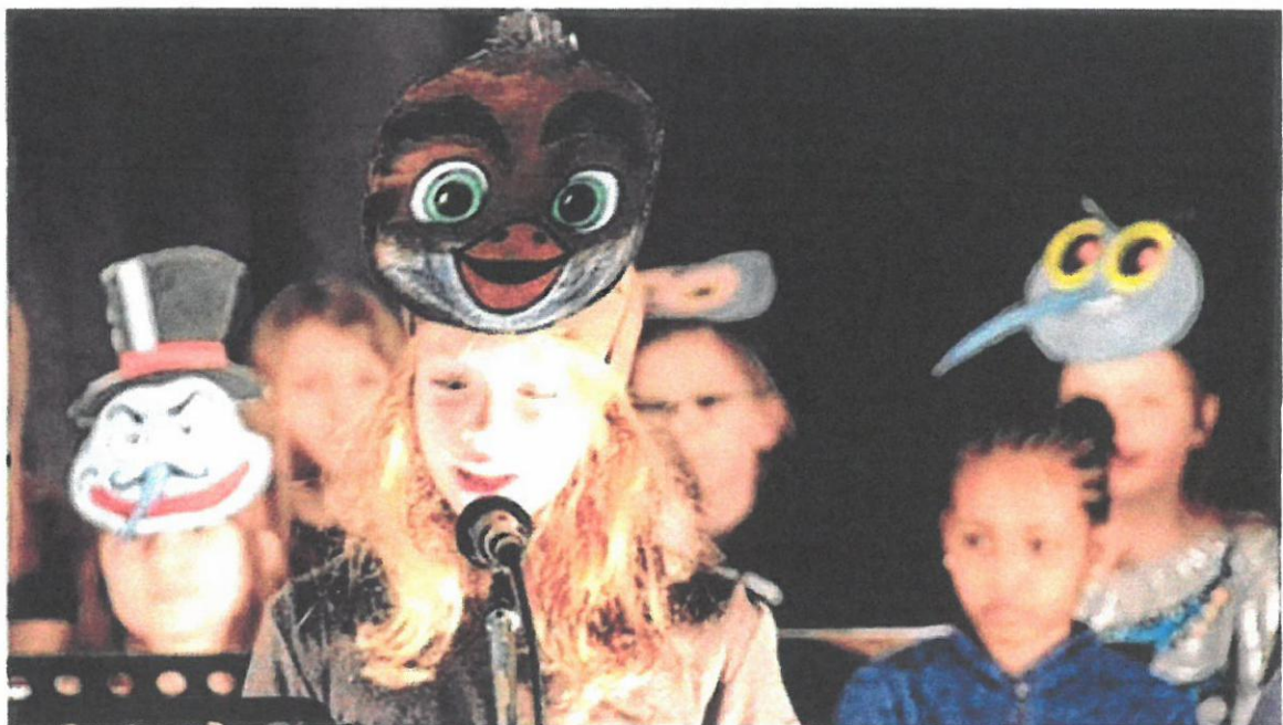
Szene aus der Liederrevue „Spatzenkunde“.