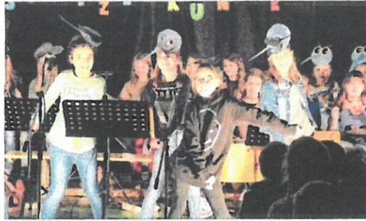
Die Schüler der Chor-AG hatten bei ihrer Vorstellung offenbar viel Spaß.