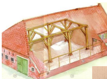
N. Hippen aus dem Buch Kulturkarte Ostfriesland